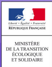
Schéma d'emploi Bilan protocole effectifs 2017-2019